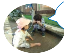
泥んこでシャンプー!

子どもが求めるものは情報ではありません。子どもは「体験と全体を把握したい」という感覚が欲しいのです。大人は子どもと一緒に発見し、子どもが新しい発見をするようにインスピレーションを提供する重要な役割を持っています。自然の奇跡と美を感じる感覚は自然の中での冒険や体験や遊びを通して得ることができます。この自然感覚を身に着けることは子ども達にとって大切です。そうすれば自分が大人になってからも自分の子どもに、この自然感覚を伝えることができるからです。「自然の循環」より 私たちが支援センターでプレーパークを行うのもこういう考えからです。自然の営みを感じながら、子どもと向かい合い充実した子育てを送ってもらいたいと思っています。今月19日にプレーパークを行います。是非ご参加下さい。