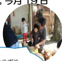
パパにのこぎり教えてもらったよ