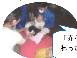
「赤ちゃんって、あったかいなあ...」

11月18日(水)に、秋月中学校で、「赤ちゃんふれあい体験」が行われました。最初にふれあい遊びを親子で楽しみ、親子共に緊張をほぐした上で、中学生と仲良く過ごしてもらおうということで自己紹介を兼ねてのお喋りタイムを取りました。その後、お母さん方に「どんな気持ちで子育てをしていますか?」とお一人ずつインタビューを行いました。「夜中に何度も起されました。」とか「パパのサポートがどんなに嬉しいか」など子育ての大変さと喜びがひしひしと伝わるお話しに、中学生たちは真剣に耳を傾けていました。