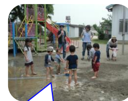
どろどろ、ピチャピチャ! 楽しいね

ひろにわ支援センターでもプレーパークを定期的で開催しています。おもちゃや決まった遊びはありません。そんな中で大人も子どもも自ら工夫してのんびりワイワイ楽しみましょう!