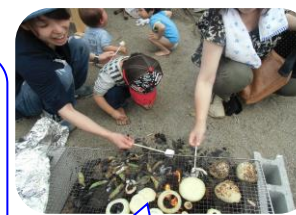
火を焚きつける様子を目を丸くして見入っている子どもたちでした。